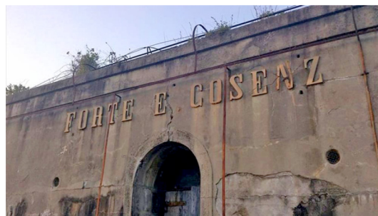
FORTE COSENZ Favaro Veneto - Venezia

Consulat Honoraire du Grand-Duché de Luxembourg a Palerme avec juridiction sur toute la Sicile 90141 Palerme, via Elvira ed Enzo Sellerio, 34 - tf. +39 91 6256218