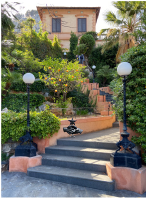
La villa du Consul à Palerme-Mondello style liberty, 1910 associé Garden Club, A.G. I.